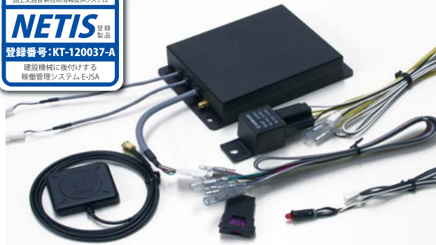
本体ユニット(W130 × H30 × D90 mm)×1、GPSアンテナ 4.0m×1 リレーハーネス×1、メインハーネス×1、LED×1 ※内容は変更する場合があります